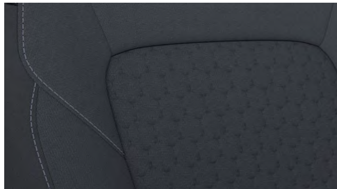
Rivestimento sedili in tessuto Barlo Black Di serie su Titanium