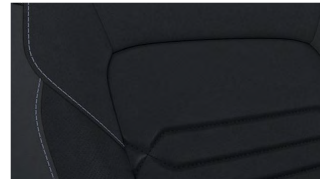
Rivestimento sedili in pelle Windsor Black Standard su Titanium X