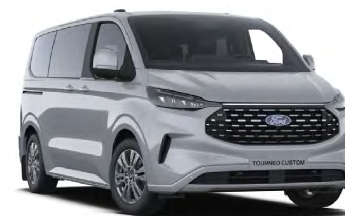
Grey Matter Colore carrozzeria Premium*