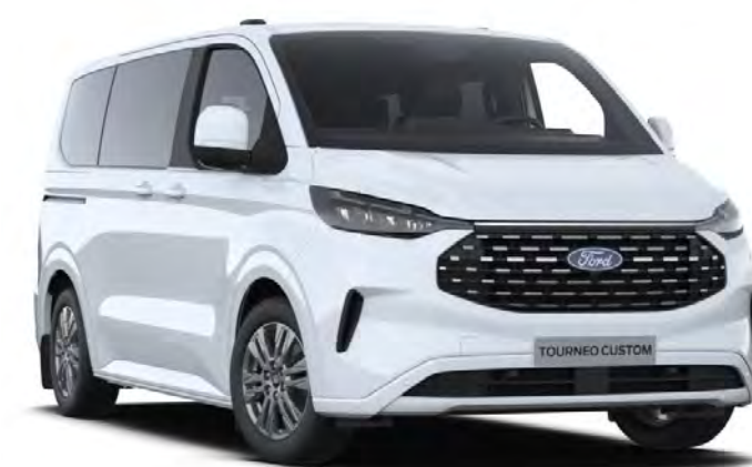
Frozen White Colore carrozzeria base