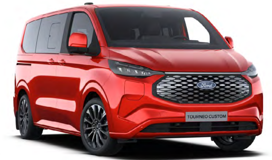
TITANIUM X BEV