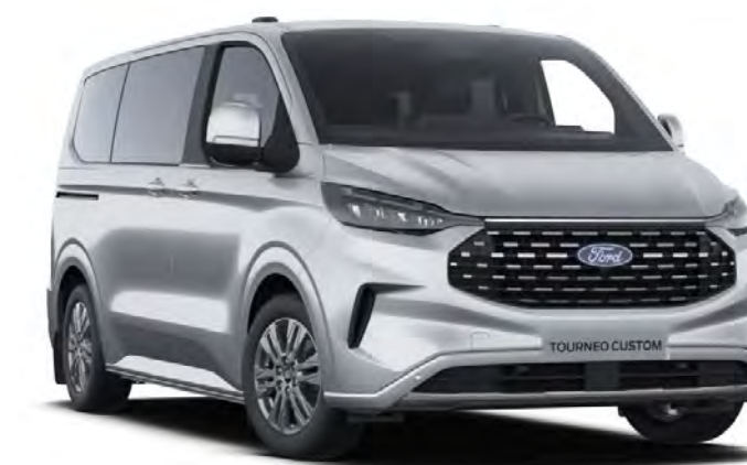
Moondust Silver Colore carrozzeria metallizzato*