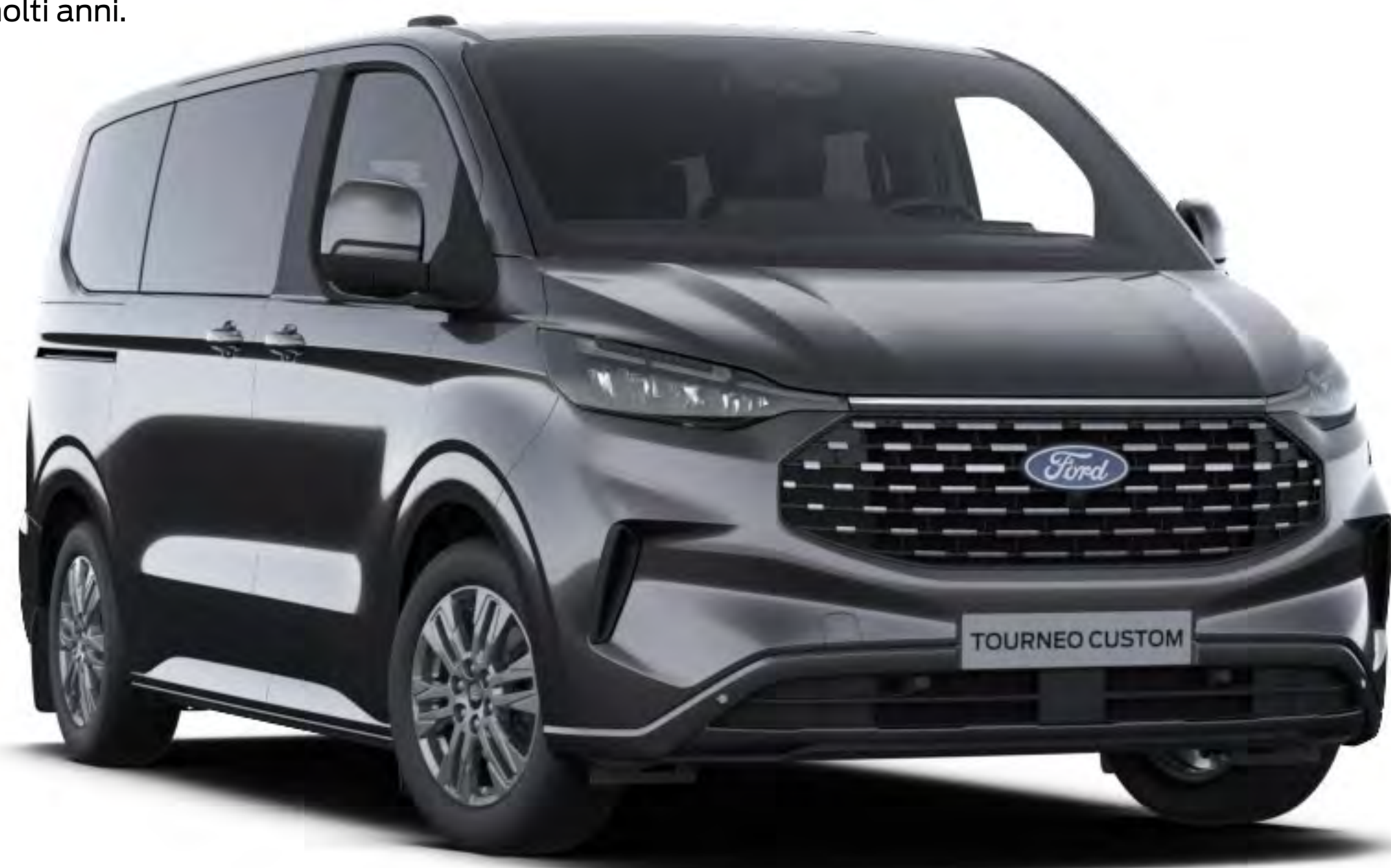
Magnetic Colore carrozzeria metallizzato*

Ford Tourneo Custom deve la sua resistenza a un processo speciale di verniciatura a più stadi. Le sezioni della carrozzeria in acciaio cerate, il rivestimento protettivo e i processi di produzione consentiranno il mantenimento dell'aspetto elegante del tuo nuovo Tourneo Custom per molti anni.