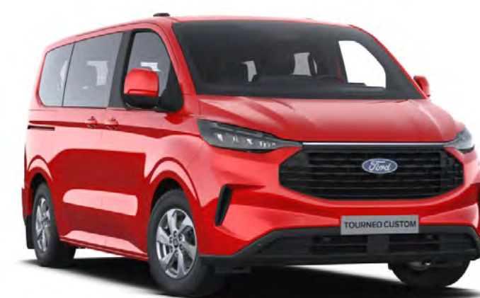
Race Red Colore carrozzeria base