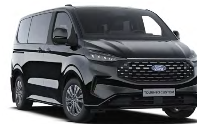
Agate Black Colore carrozzeria metallizzato*