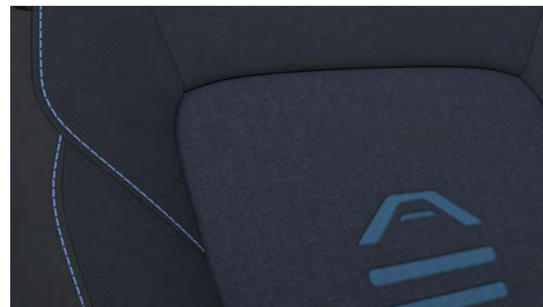
Rivestimento sedili in pelle parziale e tessuto Black Onyx con finiture Nordic Blue Standard su Active