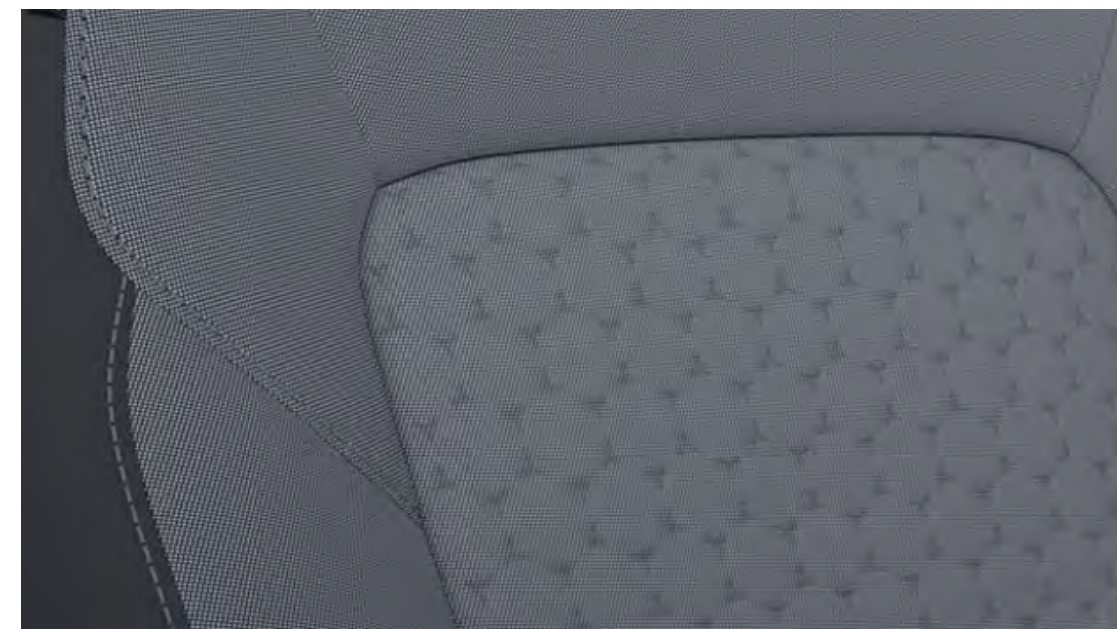
Rivestimento sedili in tessuto Barlo Grey Optional su Titanium