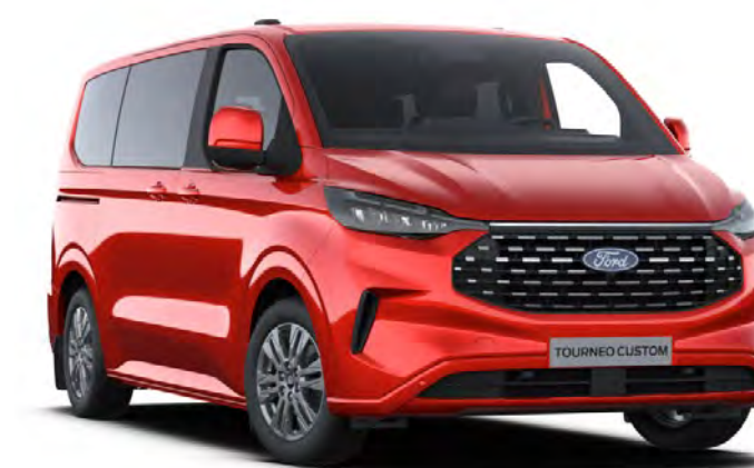
Artisan Red+ Colore carrozzeria metallizzato*