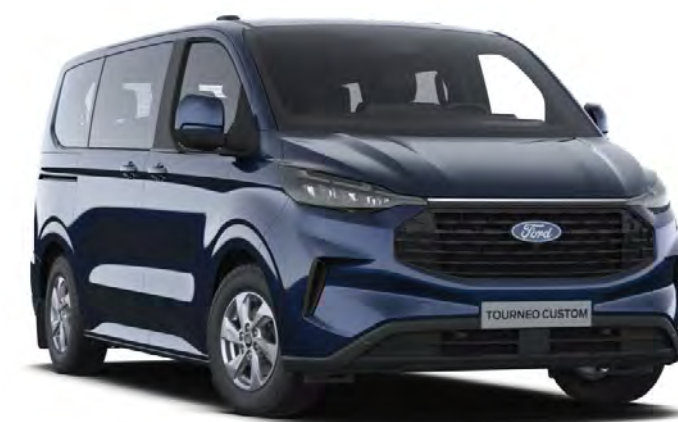
Blazer Blue Colore carrozzeria base