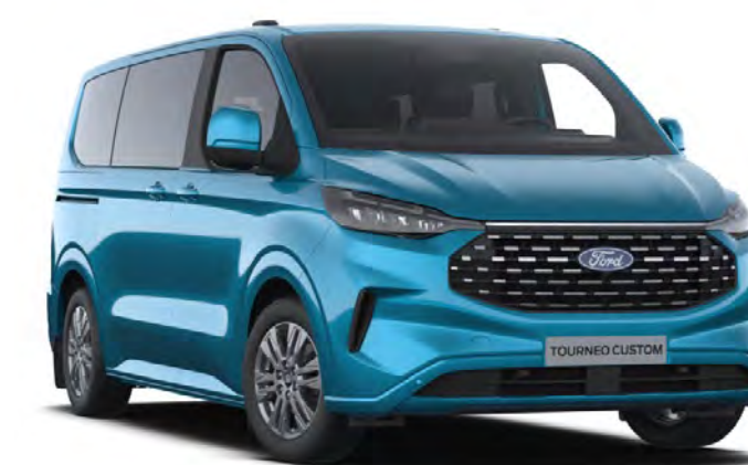
Digital Aqua Blue Colore carrozzeria metallizzato*

Nota. Le immagini utilizzate illustrano solo i colori carrozzeria e potrebbero non corrispondere al veicolo descritto. I colori e le finiture riprodotti in questa brochure possono variare dai colori reali a causa dei limiti del processo di stampa utilizzato.