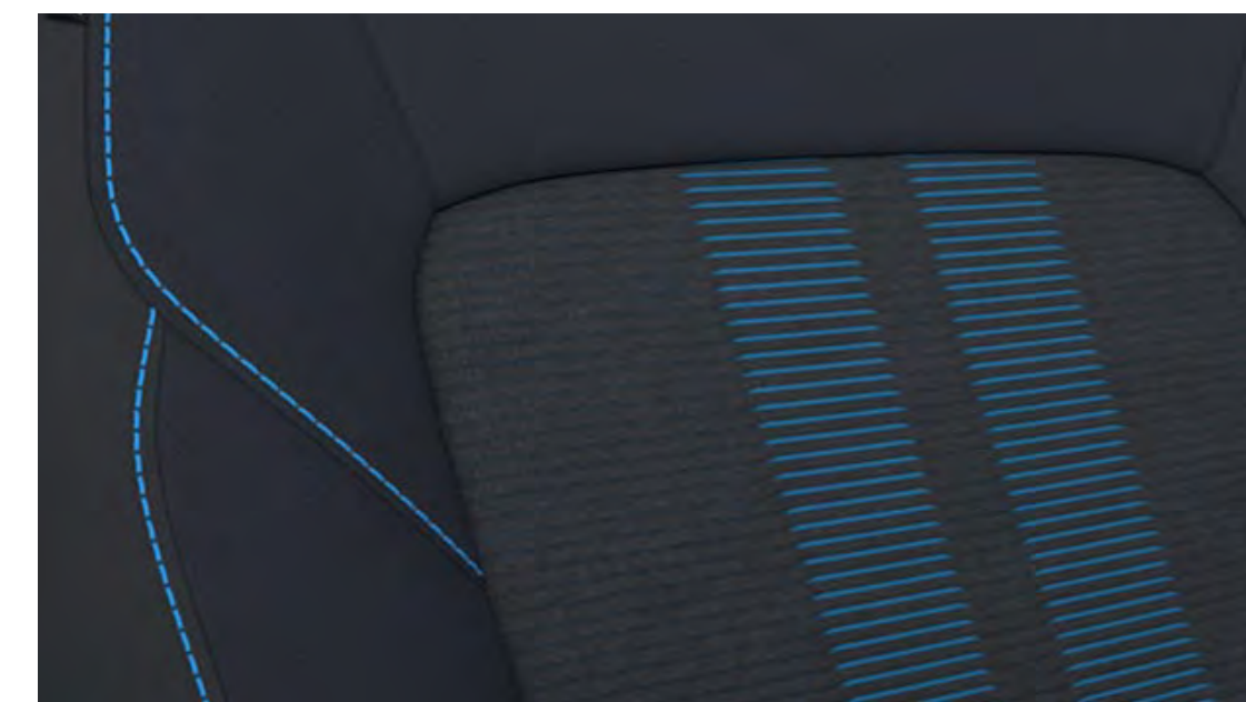
Rivestimento sedili pelle parziale e tessuto Black Onyx con finiture Digital Aqua Standard su Sport