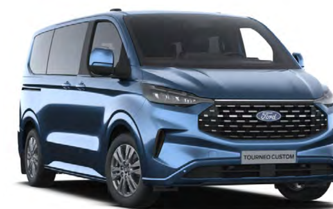
Chrome Blue Colore carrozzeria metallizzato*