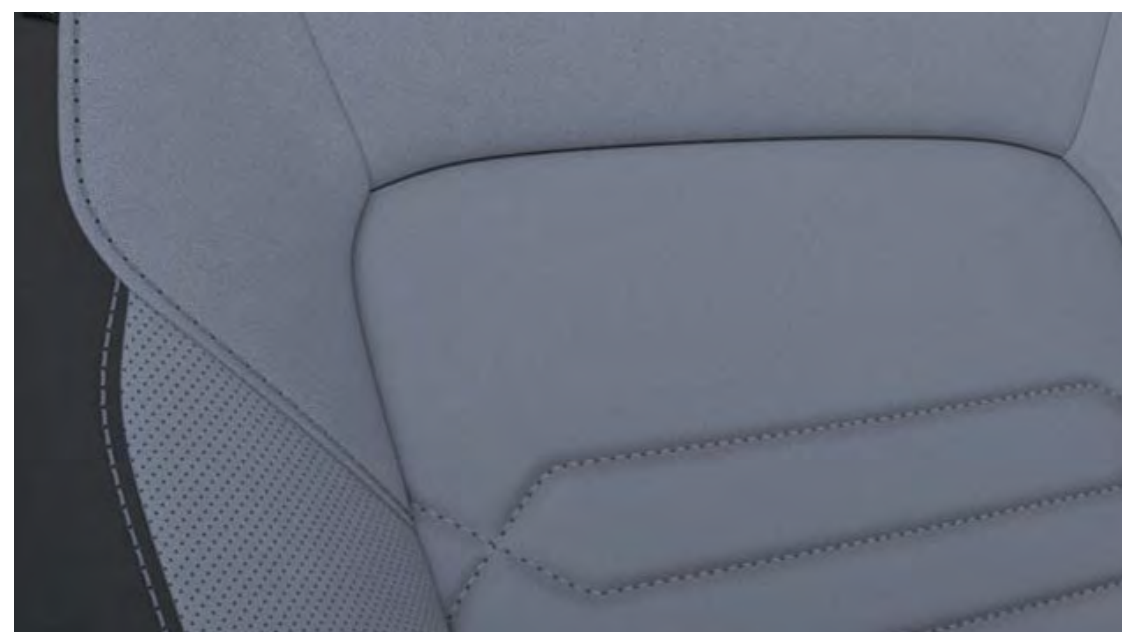
Rivestimento sedili in pelle Windsor Grey Optional su Titanium X